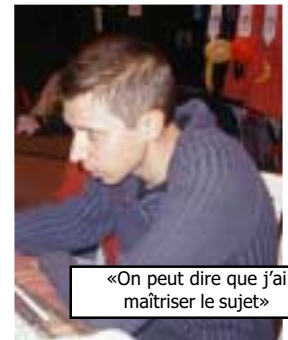
«On peut dire que j'ai maîtriser le sujet»